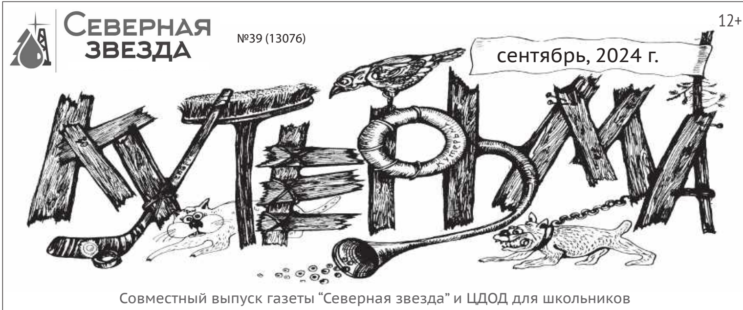
Совместный выпуск газеты «Северная звезда» и ЦДОД для школьников